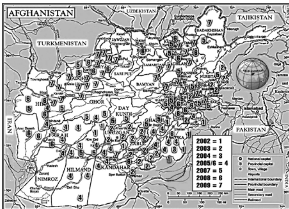
Figura 3: Expansión de la insurgencia

Los talibanes se reorganizaron e iniciaron la insurgencia contra el gobierno. La instalación de bombas en los márgenes de las carreteras, los atentados y los asesinatos selectivos terminaron por desestabilizar determinadas zonas del país. El gobierno de Karzai se granjeó la adhesión de antiguos señores de la guerra y jefes militares. El