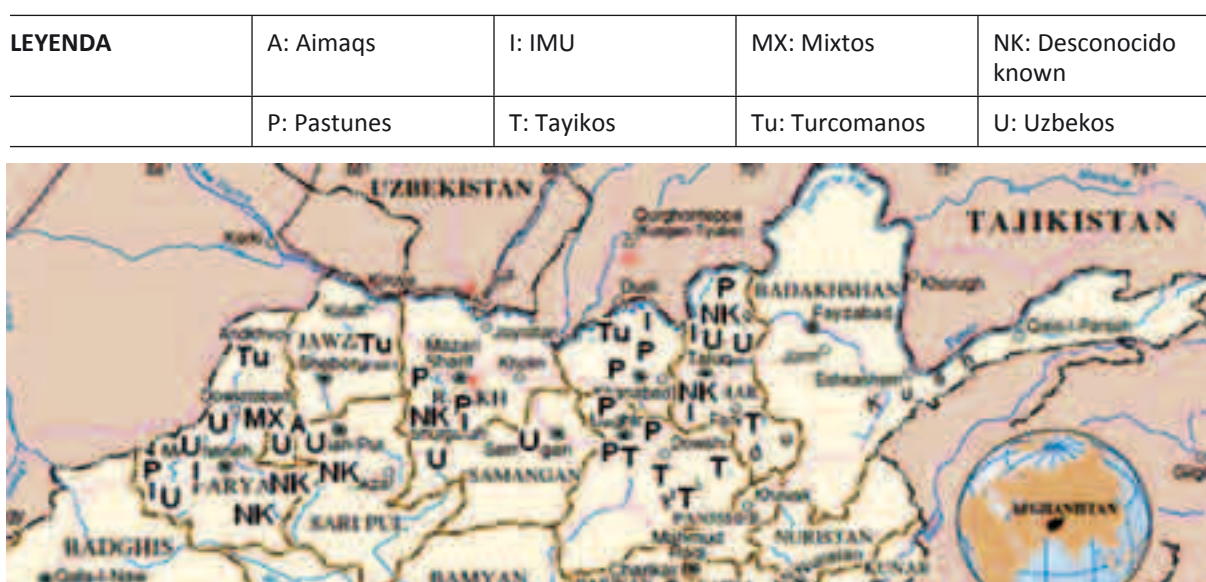
Figura 4: Composición étnica de los frentes talibanes conocidos en el norte

En la figura 4 se muestra la composición étnica de los frentes talibanes conocidos en el norte de Afganistán durante el verano de 2010 (169) :